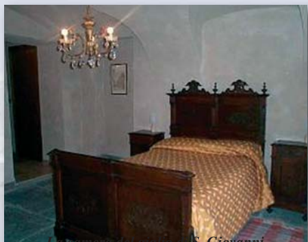
La camera del giglio al S. Giovanni

Dispone di 25 posti letto, 6 camere con bagno e balcone tutte con vista sulla valle e sulle meravigliose montagne della conca della frazione Chiappi (1710 m.s.l.m.) e di una suite (due camere da letto con soggiorno e bagno) con terrazzo.