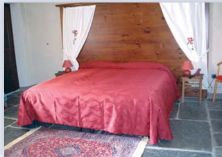
La camera del Rododendro