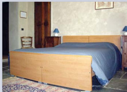
La camera Regina delle Alpi

Cucina tradizionale della montagna occitana curata direttamente dai proprietari. La tipicità della cucina risale a molti anni or sono quando si studiò il mangiare povero delle valli con la pubblicazione del libro "Mac de Pan".