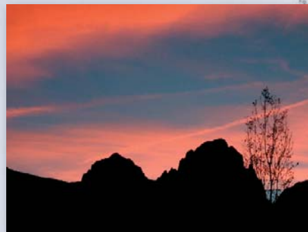
Rocche Parvo al tramonto

Ogni anno si organizzano corsi di cucina occitana, visite ai laghi alpini, visita ai paesi abbandonati, settimane alla scoperta della flora alpina.